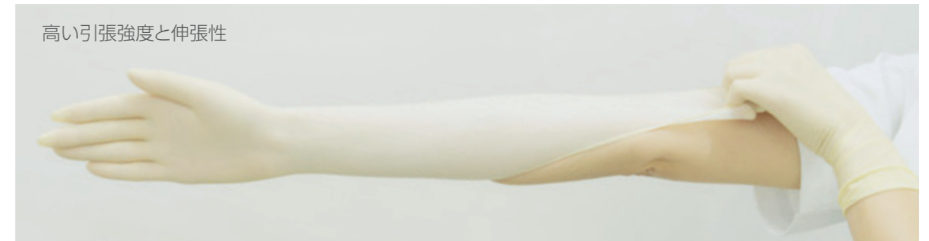
高い引張強度と伸張性

「皮膚への刺激性試験」および「水溶性たんぱく質の溶出量測定」の結果において、国際規格ISO 10993の医療機器基準を満たしています。