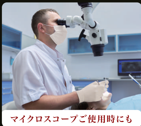
マイクロスコープご使用時にも