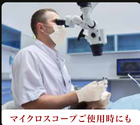
マイクロスコープご使用時にも