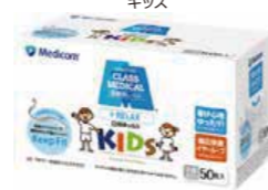
クラスメディカル リラックス キッズ