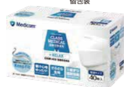
クラスメディカル リラックス 個包装