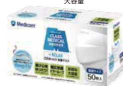
クラスメディカル リラックス 大容量